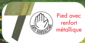
TABLE PIQUE-NIQUE CANADA

Pin traité autoclave classe IV certifié FSC Dimensions : L 2000 x l 1600 x H 750 mm Lames assise et plateau ép. 45 mm Largeur du plateau : 890 mm Assises L 2000 mm Livrée pré-montée À sceller anti-vandalisme : renfort métallique à l'intérieur des pieds rendant le sciage impossible Traitement garanti 10 ans