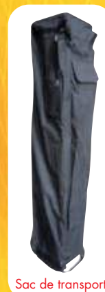
Sac de transport

Livré avec son kit d'haubanage et un sac de transport avec pochette pour ranger les accessoires