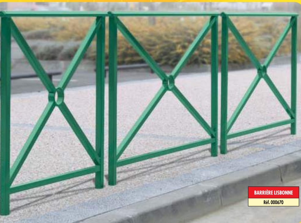
BARRIÈRE LISBONNE Réf. 000670