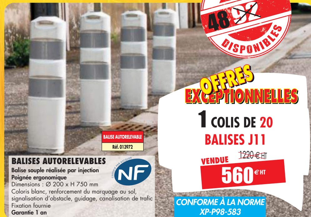
BALISE AUTORELEVABLE Réf. 013972