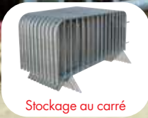
Stockage au carré