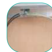
Poignée de réglage